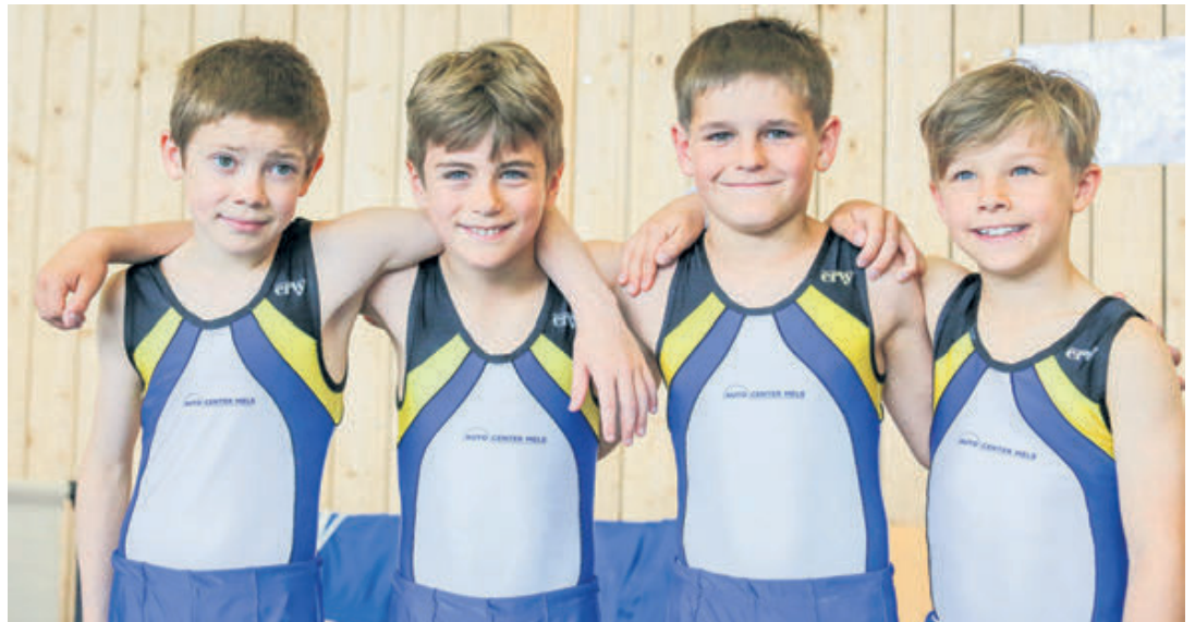
Das Team der TWSO bei den Schweizer Meisterschaften im Kunstturnen in Sargans.

Ein Highlight des ersten Tages war aus (über-)regionaler Sicht