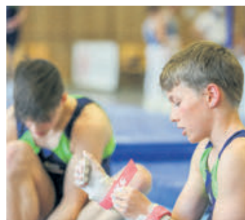
Die Sportler bereiten sich vor.